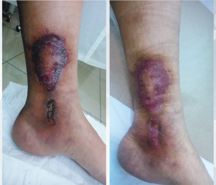
Úlcera: evolución a 5 meses

Coadyuvante en el tratamiento de heridas. Lavar el área a tratar, enjuagar con abundante agua y secar bien. Aplica Heribac gel o Heribac aceite sobre el área dañada. Cubrir con gasa estéril.