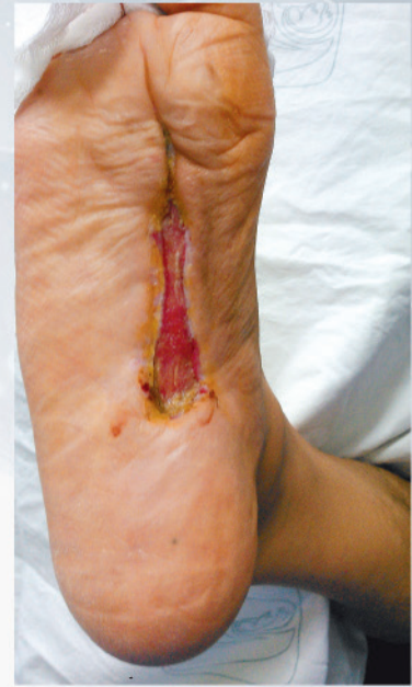
Pie diabético: evolución a 5 meses