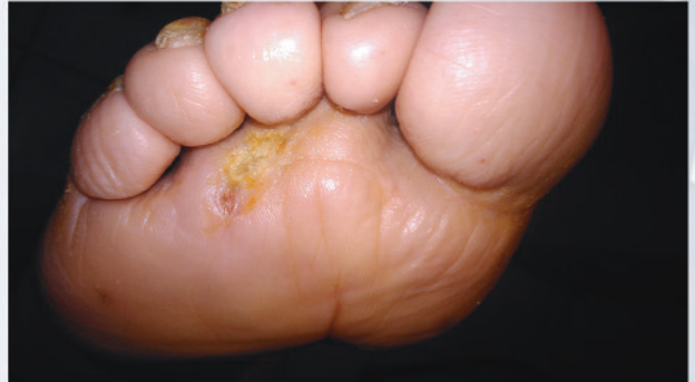
Pie diabético: evolución a 5 meses